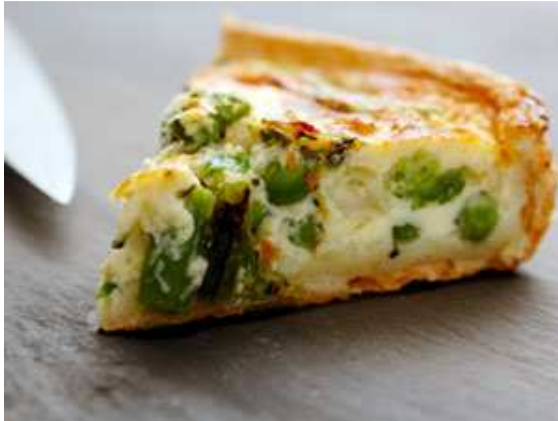
Quiche met prei, broccoli, ham en kaas